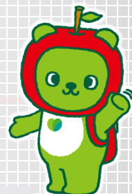
長野県PRキャラクター 「アルクマ」